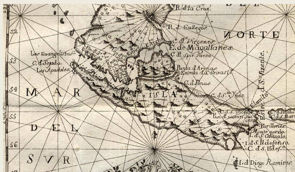
Detalle da carta de Pedro Teixeira reimpresa no s. XVIII onde veñen os nomes postos na viaxe dos Irmáns Nodales e as illas de Diego Ramírez descubertas en dita expedición.

Partiron as naves de Lisboa o 27 de setembro. Ao chegar a Río de Xaneiro, a onde deberon arribar pola rotura do pau maior da carabela de Gonzalo, houbo unha tentativa de rebelión dalgúns mariñeiros que foron substituídos por voluntarios residentes en Brasil. O día 16 de xaneiro fondeaban nas inmediacións do cabo de las Virgenes , porta do paso magallánico. Dende alí, cara o sur, írían recoñecendo as descubertas holandesas. Chegaron ao cabo que denominaron de San Vicente e, outro ao que lle puxeron San Diego . Era o comezo do estreito de Le Maire , ao que eles chamarían de San Vicente . Dixeron del que tiña dúas veces o ancho do de Xibraltar. Navegar por aquelas augas era dificultoso pola forza das correntes. Unha vez superado o estreito acharon un cabo ao que denominaron del Buen Suceso , na honra dunha das carabelas. Na praia que había alí collerían auga e tomarían contacto cos nativos que se acercaron de forma amigable aínda que temerosos, polo que eles evitaron producirles ningún dano.